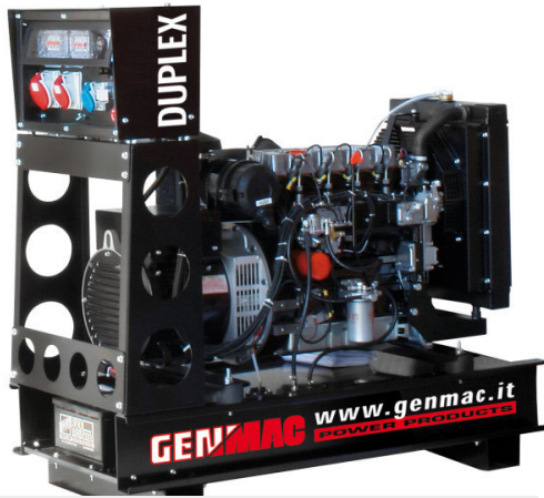
Изображение только для иллюстрации