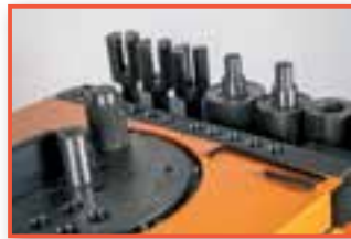
Sabit Göbekli Неподвижный палец

* Комплект поставки может меняться в зависимости от модели и производительности станка.