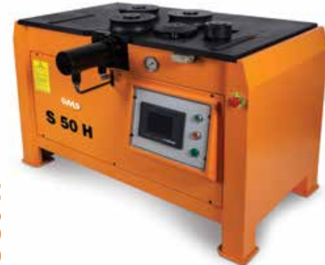
S 50 H