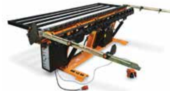
HB 12 HB 12 X6