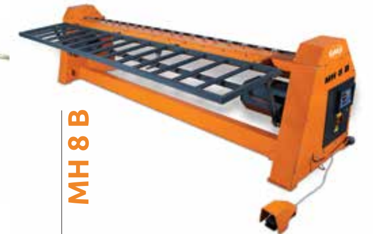
MH 8 B