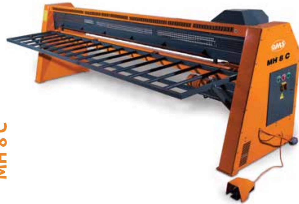
MH 8 C