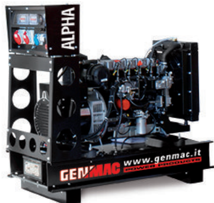
Изображение только для иллюстрации